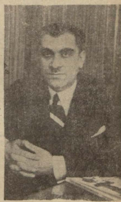
Maarif Vekili Hasan Ali Yücel

Vekil ders yılının başlaması dolayısıyla talebeye çalışkan ve iyi ahlâklı olmalarına dair bazı öğütlerde bulunduktan sonra şunları söylemektedir: