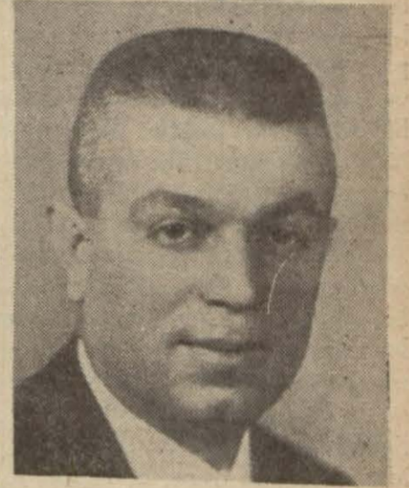
Dr. Behçet Uz

Ankara, 30 (Hususi) — Ticaret Vekâletinde bu sabah, Ticaret, Da- hiliye, Ziraat Vekâletleri Müsteşar- ları, Toprak Mahsulleri Ofisi U- mumi Müdürü bazı servis müdürleri saat 13,30 a kadar süren bir top- lantı yapmışlardır. Bu toplantıda, İstanbul, İzmir ve Ankarada olduğu gibi diğer bazı vilâyetlerde tanzim satışına devam edilmesi için müddetin uzatılması hakkında kararlar verilmiştir. Kararın tatbi- kına yarın geçilecektir. Bu vilâyet- lerin isimleri bir Koordinasyon kar- arı ile ilân edilecektir. Yakında iâşe işlerine mütedair bazı kararlar neşri beklenmektedir.