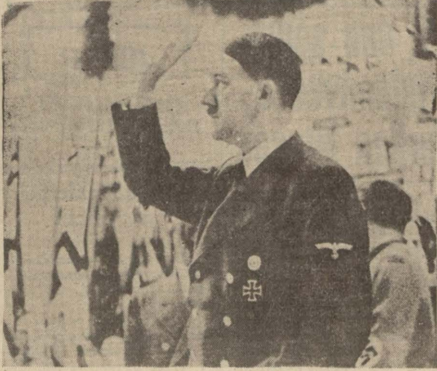
Alman devlet reisi Adolf Hitler

Berlin 30 (A.A.) — Yarı res- mi bir kaynaktan bildiriliyor: Almanyanın Ankara büyük elçi- si von Papenin Almanya gelişi hakkında birçok tahminler yürü- tülüyor. Salâhiyetler mahfiller büyük elçinin seyahatinin hiç bir siyasî maksadı bulunmadığını söylüyorlar.